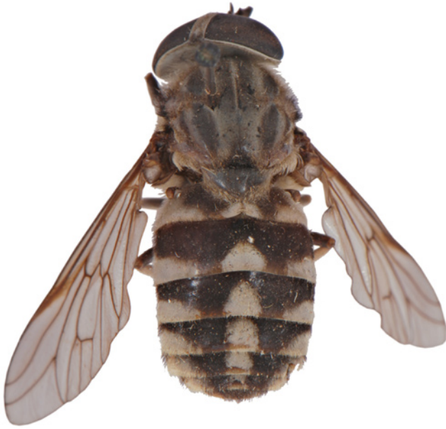
4. Tabanus rectus (Tabanidae).