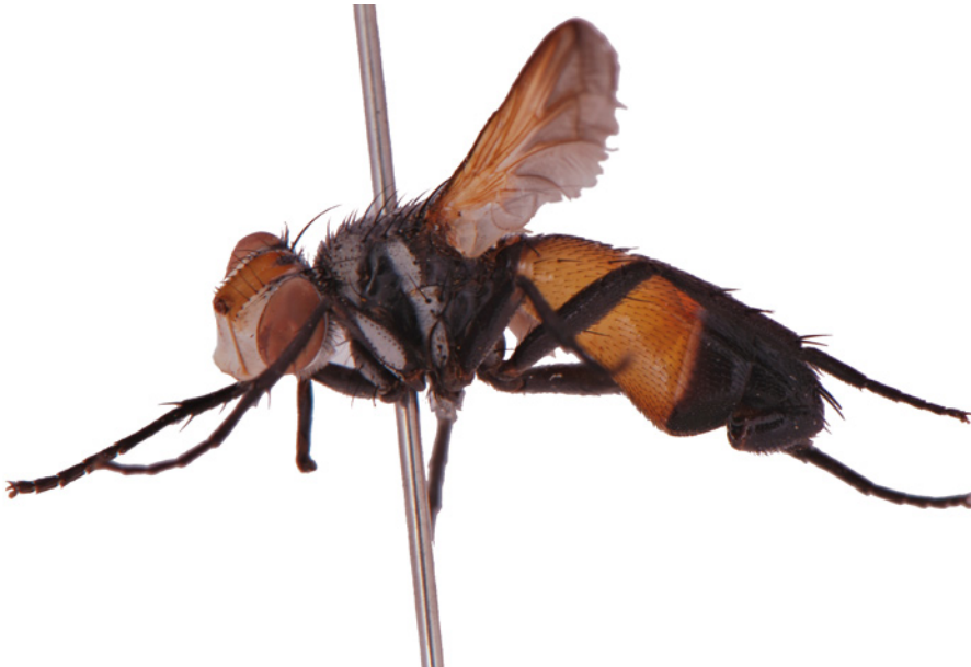
6. Cylindromyia rufifrons (Tachinidae).