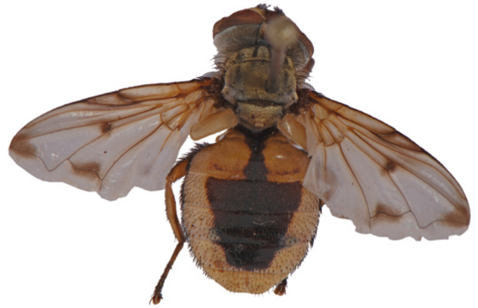
5. Ectophasia leucoptera (Tachinidae).