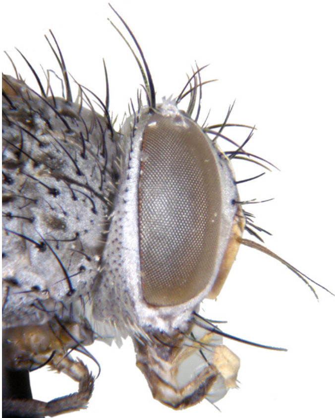
8. Metacemyia aartseni (Diptera: Tachinidae).